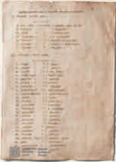
საქართველოს დემოკრატიული რესპუბლიკის სამაზრო ერობებში შემავალ თემთა სია. დოკუმენტი დაცულია საქართველოს ეროვნულ არქივში: სცსა, ფ. 1921, აღნ. 1, საქ. 254.

ქალაქები. საქალაქო თვითმმართველობის ჩამოყალიბება XIX საუკუნის II ნახევარში იწყება. ამით იგი წინ უსწრებდა სამაზრო და სათემო თვითმმართველობის შემოღების პროცესს. დიდ ქალაქებს გააჩნდათ სამაზრო სტატუსი, ამავე დროს ყველა ქალაქს, მიუხედავად სიდიდისა, ჰქონდა თვითმმართველი სტატუსი.