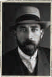
ნიკოლოზ (ნიკო) ელიავა (1876 - 1937)

სხვადასხვა საკითხებში სფეროს მარეგულირებელი კანონმდებლობა პერმანენტულად იცვლებოდა. 1920 წლის ბოლოსათვის უკვე მომზადებული იყო რიგი კანონპროექტებისა (ახალ ადმინისტრაციულ ერთეულებად დაყოფის, საერობო ფინანსების, თემის და ა.შ. შესახებ), რომლებიც ქმნიდნენ ერთიანი სისტემის ჩამოყალიბების საფუძველს და რომელთა მიღებაც საქართველოს დამფუძნებელი კრების 1921 წლის საგაზაფხულო სესიაზე იგეგმებოდა.