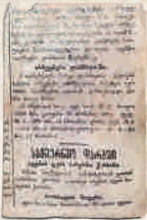
ცნობა ლანჩხუთის საქალაქო საბჭოს ხმოსანთა არჩევნების შესახებ. გაზ. „საქართველოს რესპუბლიკა“, 1919, №32, გაზეთი დაცულია თსუ ბიბლიოთეკაში.