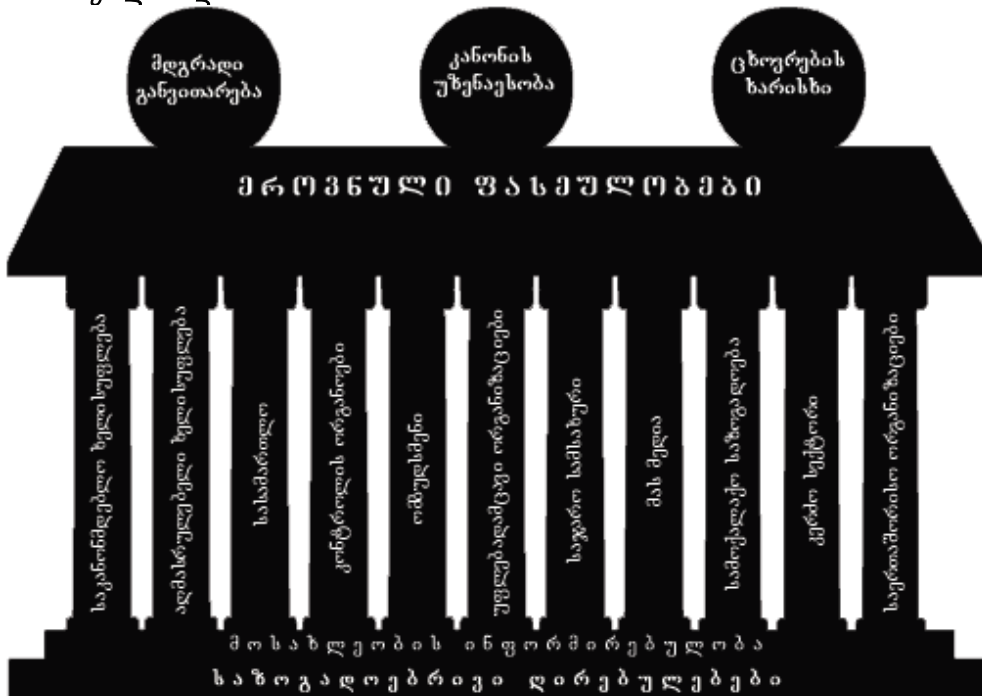
ნახ. 1. “კოლონადა” 10

კოლონადის საფუძველში ჩადებულია მისი ყველაზე მნიშვნელოვანი ელემენტი - საზოგადოების ფასეულობები: